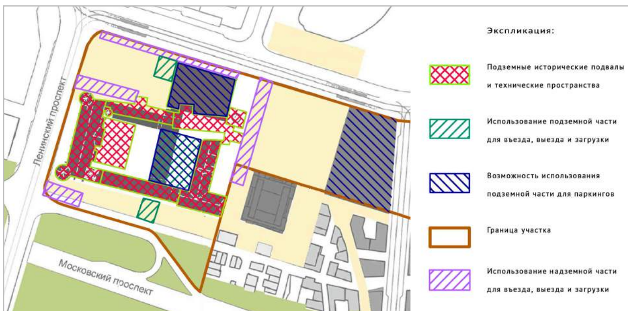
В. Уточненная схема использования подземного и наземного пространства историко-культурного комплекса «Пост-Замок».